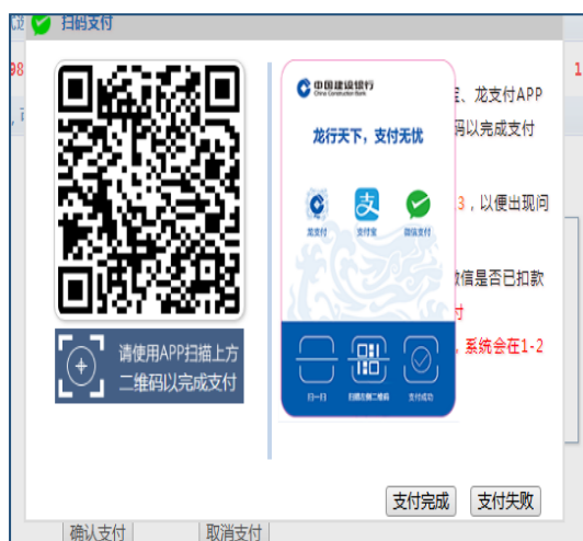
(中国建设银行支付界面)