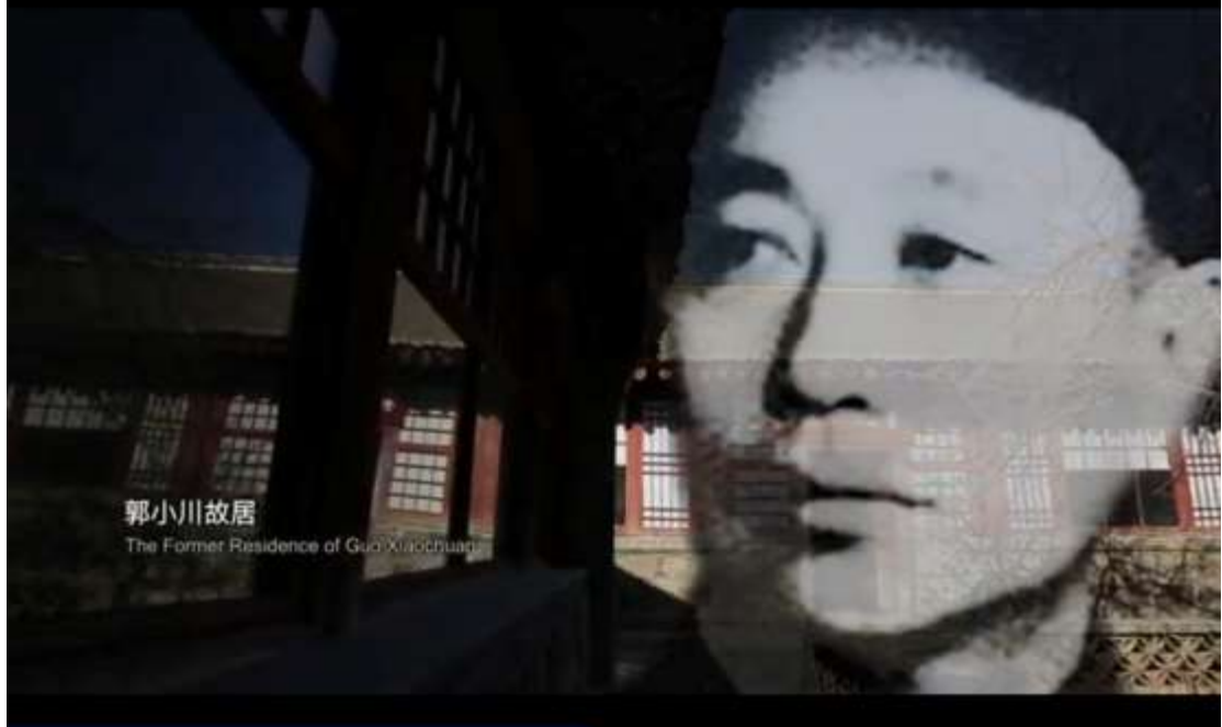
郭小川故居 The Former Residence of Guo Xiaochuan

勾勒出丰宁先民生活的印记 sketches the ancestors' life in the ancient Fengning.