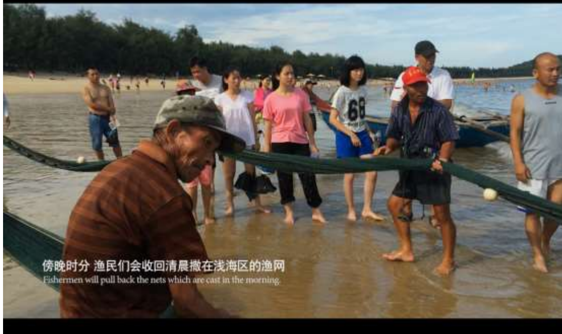
傍晚时分 渔民们会收回清晨撒在浅海区的渔网 Fishermen will pull back the nets which are cast in the morning.