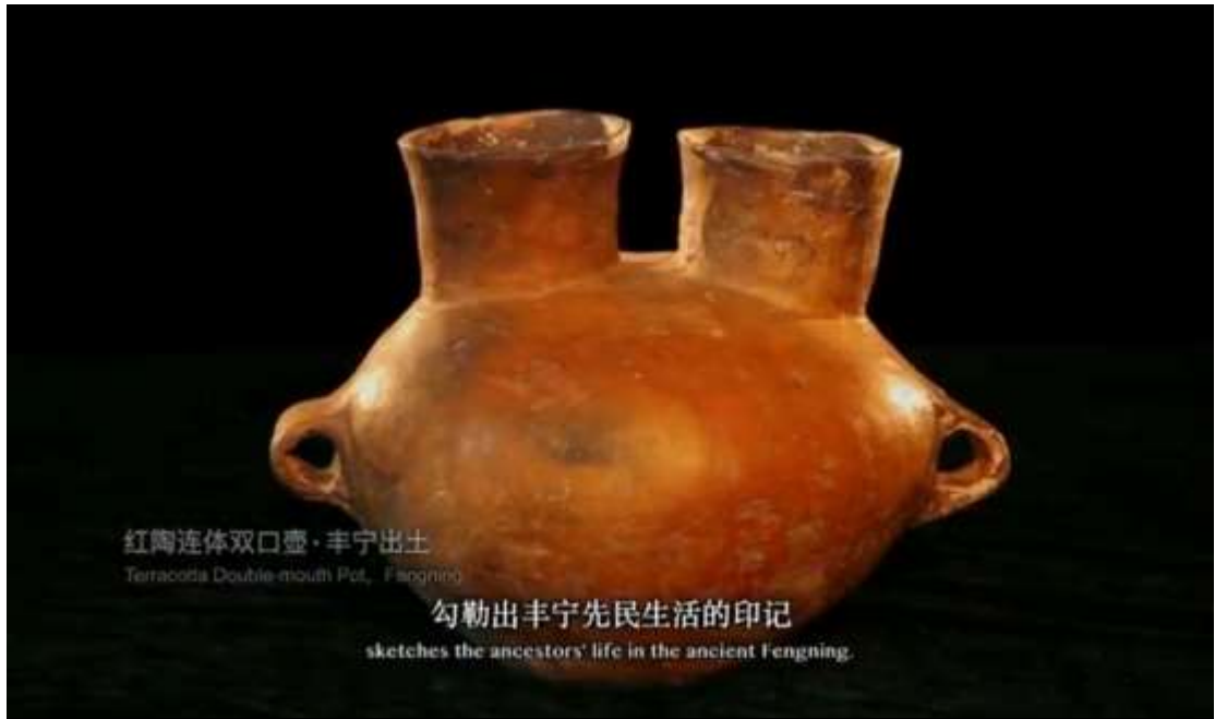
紅陶连体双口壺·丰宁出土 Terracotta Double-mouth Pot, Fengning

勾勒出丰宁先民生活的印记 sketches the ancestors' life in the ancient Fengning.