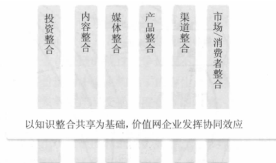
图3 价值网企业以知识整合共享协同创造价值

(2) 内容整合: 以顾客价值为导向,从核心创意原点出发,价值网企业通过协同创作跨媒体的动画内容,使动画电影、电视动画、漫画、网络动画、移动媒体动漫等内容生产企业在知识共享的基础上,协作互补,共同创造顾客价值。